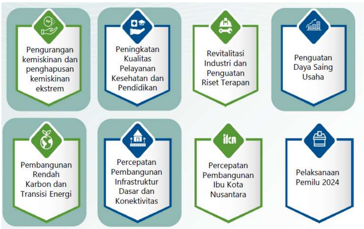
Gambar 3.1 Arah Kebijakan RKP Tahun 2024

Pada Tahun 2024, Tema Pembangunan Nasional yang ditetapkan dalam RKP Tahun 2024 adalah "Mempercepat Transformasi Ekonomi yang Inklusif dan Berkelanjutan" dengan 8 arah kebijakan sebagai berikut: