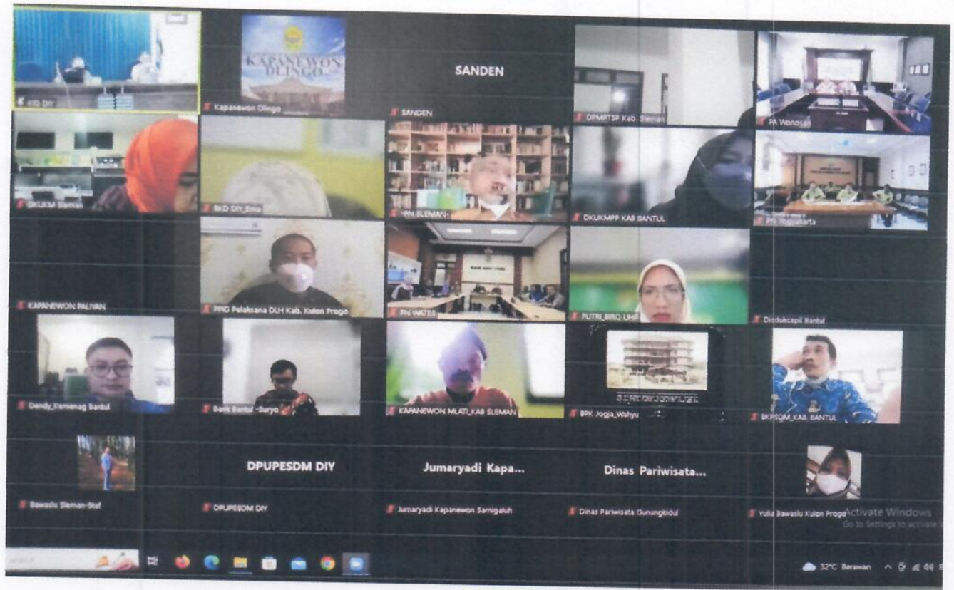
Evaluasi Penyelenggaraan Monev KID secara daring