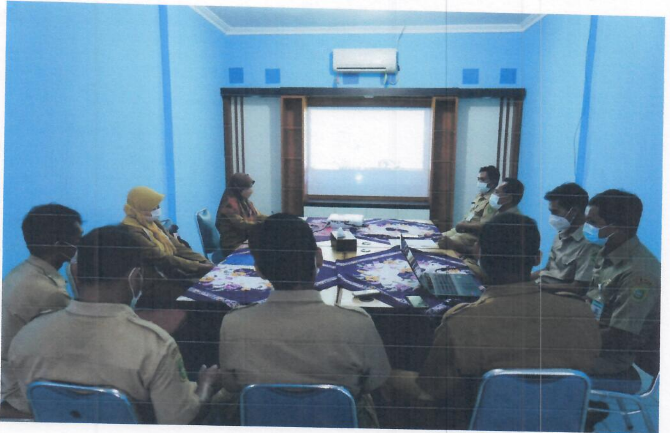
Pembinaan dan Pendampingan dari Dinas Kominfo