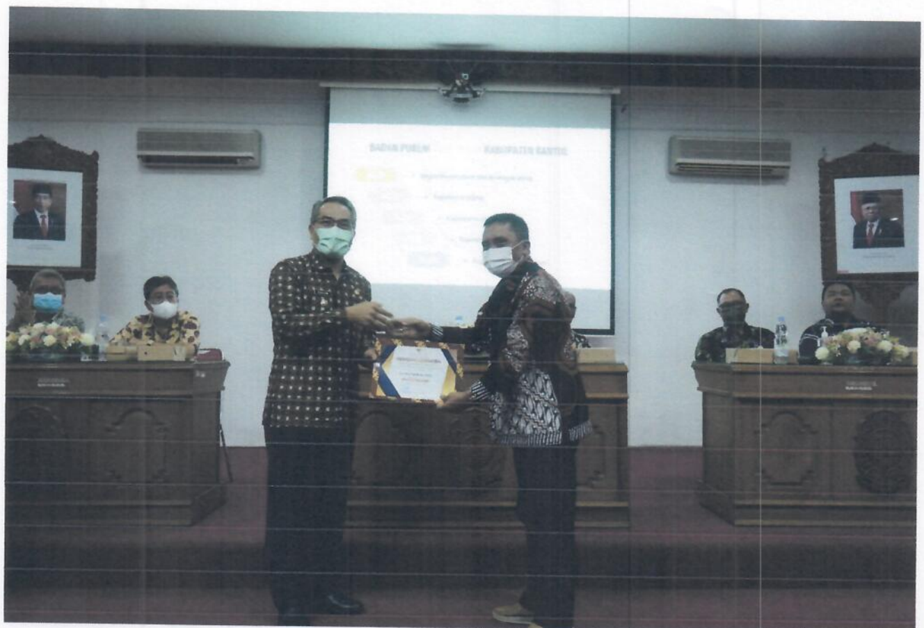
Evaluasi Hasil Monev Keterbukaan Informasi Publik dan Penyerahan Piagam Penghargaan di Gedung Induk Lantai 3, Kompleks Parasamy Kabupaten Bantul.