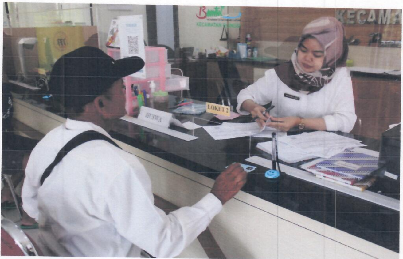
Petugas Memberikan Informasi kepada Pemohon Informasi